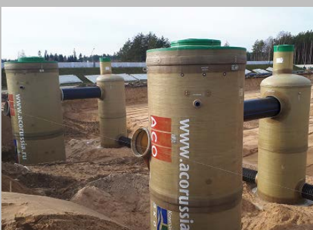
Индустриальный парк "Великий камень" "Оборудование для очистки поверхностного стока в составе ЛОС накопительного типа с самым большим в мире безбетонным аккумулирующим резервуаром АСО StormBrixx, Минск, Республика Беларусь